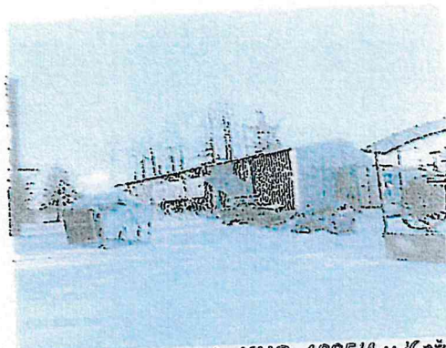
hala č.s. 2068 na parcele KNC 1295/4 v Kežmarku