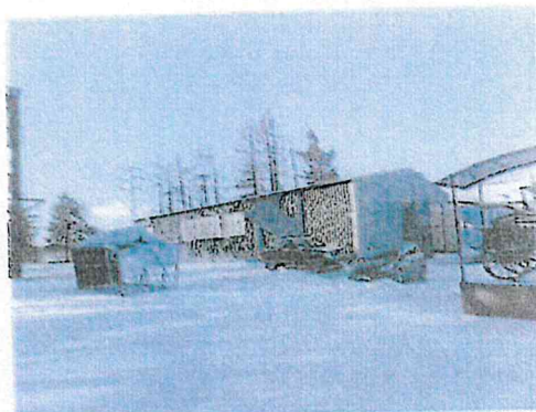
hala č.s. 2068 na parcele KNC 1295/4 v Kežmarku