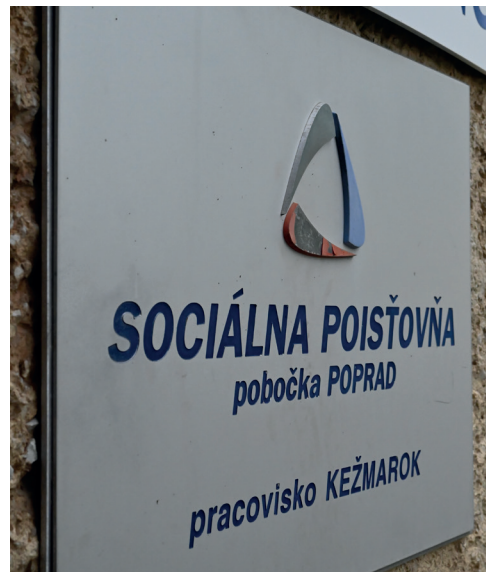
Sídlo pobočky Sociálnej poisťovne v Kežmarku.

Suma vychádza z evidovaných období, t. j. odpracovaných rokov a z vymeriavacích základov. Číže z hrubej mzdy, z ktorej sa platilo poistné. Občanovi v mladom či strednom veku vyjde samozrejme suma nižšia, keďže nepracoval dostatočný počet rokov – ale v EUP má prie-