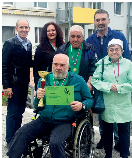
Naši seniori sa tohto roku, tak ako aj po iné roky, zúčastňujú petangovej ligy.

V mesiacoch september a október okrem pravidelných pestrých aktivít, ako sú relaxačné cvičenia, športové aktivity, tréningy pamäte, tvorivé činnosti, biblické stretnutia, kulinárske stretnutia, cestovateľské okienka, hádanky, súťaže, maľovanie a iné, ktoré pripravujú pre našich seniorov sociálne pracovníčky, plánujú výlet do ZOO v Spišskej Novej Vsi, narodeninovú oslavu seniorov, ktorí v tomto období oslávia svoje okružie životného jubileá, vystúpenia detí pri príležitosti mesiaca úcty k starším a väčšou akciou v zariadení bude ukončenie tohtoročnej Podtatranskej petangovej ligy, ktorej sa zúčastní 24. septembra šesť zariadení sociálnych služieb. „Seniorov najviac trápia ich zdravotné ťažkosti, najmä keď nedokážu samostatne chodiť a tiež odlúčenie od svojich rodín. Zároveň ich najviac tešia časté návštevy detí, vnúčat a pravnúčat. Žiaľ, časté návštevy rodín nie sú samozrejmosťou u všetkých, a tak sa zamestnanci zariadenia, najmä sociálne pracovníčky a opatrovateľky snažia seniorom sprí-