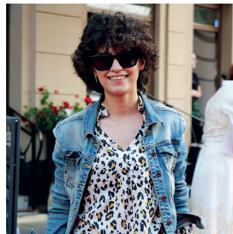
Z benefičnej módnej prehliadky Na vlnách módy Bielej vody.