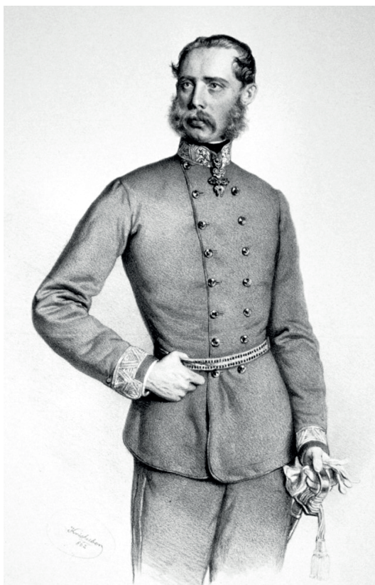
Portrét Karola Ľudovíta.