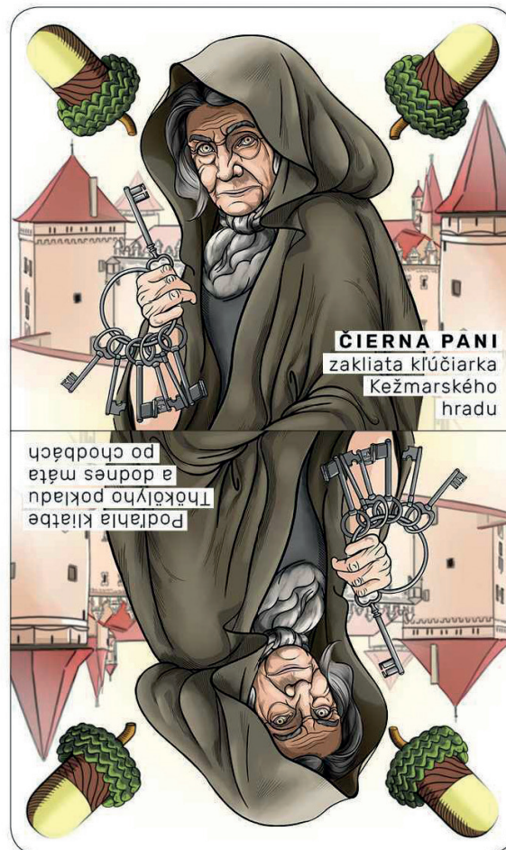
ČIERNÁ PANI zakliata kľučiarke Kežmarského hradu

Len čo uskutočnila svoj úmysel, na hradné dvere sa ozvalo strašné búchanie. Na údiv kľučiarke sa objavil mladý hradný pán. Ženu odsotil, hnal sa do klenotni-