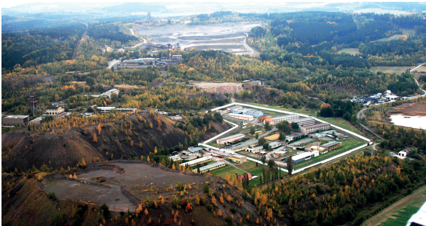
Pozostatky banickej činnosti v okolí mesta Příbram.

Štvrtým dielom miniseriálu o partnerských mestách Kežmarku sa dotkneme českého mesta Příbram. Ním blok o dvojici českých miest zároveň uzatvoríme. Ak budete mať niekedy cestu do Prahy, oplatí sa urobiť si zhruba 50-kilometrovú odbočku do tohto 33-tisícového mesta. Příbram sa totiž – rovnako ako Kežmarok – hrdí statusom kráľovského mesta.