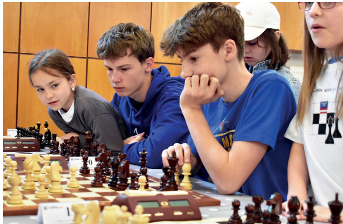
Mladý šachista v akcii na turnaji.