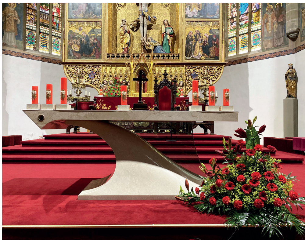
Nový mobiliár Baziliky svätého Kríža v Kežmarku.

Naša výnimočne krásna Bazilika svätého kríža v Kežmarku má za sebou významnú rekonštrukciu. Provizórny drevený obetný stôl, ambónu a svietnik pod paškál vymenili po dlhých mesiacoch kamenárskych príprav ich nové podoby, ktoré si tento majestátny chrám jednoznačne zaslúži.