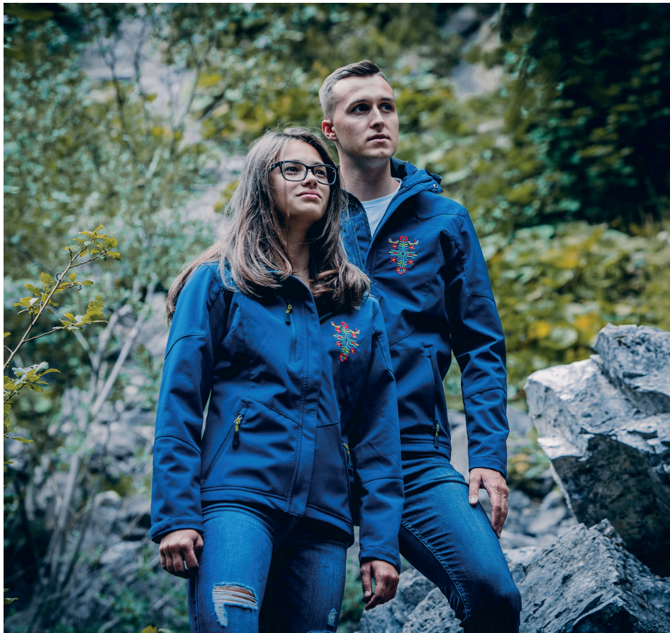
V oblečení s vyšívanými vzormi od firmy CreativeArt.

Ľudia stojaci za CreativeArt tvrdia, že hoci sú malou rodinnou firmou, ich služby využíva veľké množstvo pravidelných zákazníkov z celého