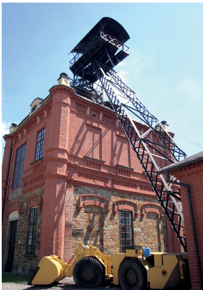
Ševčínský důl, jeden z objektov Hornického múzea Příbram.

Významnosť banického dedičstva dokladuje Hornické múzeum Příbram , jedno z najrobustnejších baníckych múzeí v Česku. Múzeum zároveň spravuje rozsiahly banícky skanzen. V meste je to jedna z lokalít, ktoré rozhodne odporúčame navštíviť.