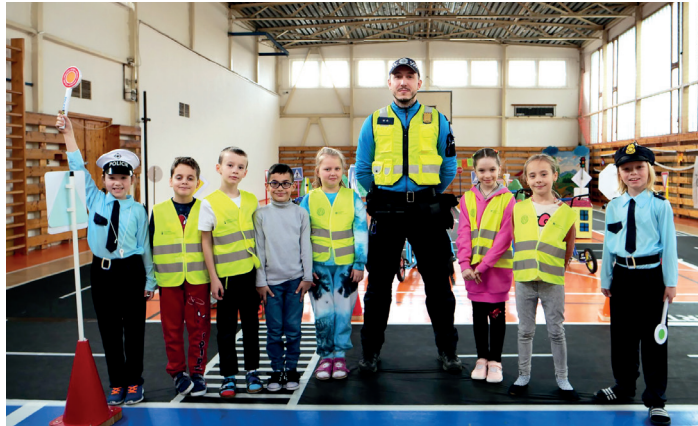
Mestská polícia Kežmarok si kladie dôraz aj na prevenciu.

je dieťaťu určiť bezpečné miesta na prechádzanie vozovky a tiež im priamo na mieste vysvetliť základné zásady bezpečného prechádzania cez vozovku. Deti je potrebné viesť k tomu, aby sa v cestnej premávke správali vždy zodpovedne. Veľmi dôležité je naučiť dieťa, aby nevstupovalo na vozovku spomedzi za-