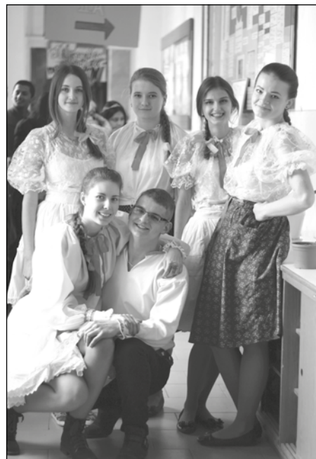
Gymnazisti v krojoch prezentovali svoj región.