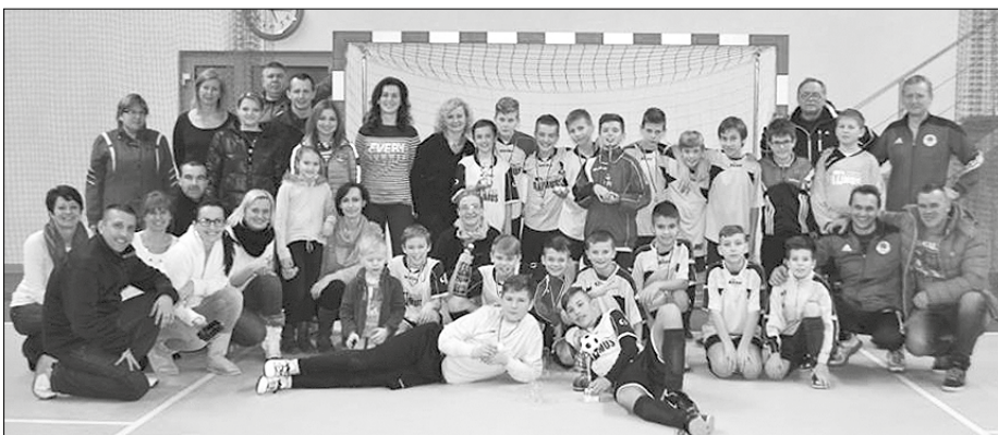
Mladé športové talenty spolu s rodičmi.

Vo finálovej skupine sa stretli družstvá umiestnené na prvých dvoch miestach základných skupín a v bojoch o medaily previedli skvelý futbal, ktorý dvíhal zo sedadiel všetkých prítomných divákov. Favoritom bolo družstvo z Vranova, ale naši reprezentanti ich hneď v prvom stretnutí finále dokonale zaskočili a po heroickom výkone sme vyhrali 2:0. V poslednom