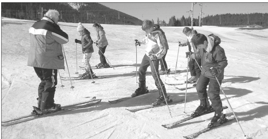
Počasié prialo lyžiarskému výcviku.