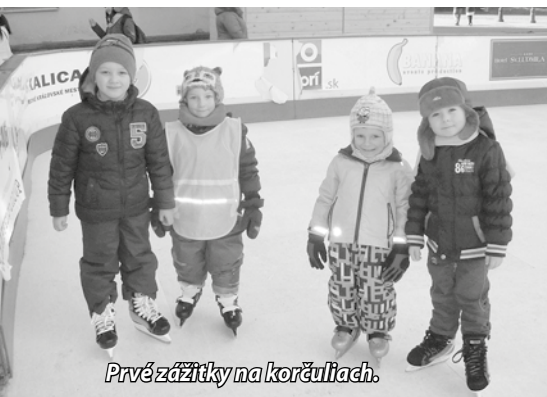
Prvé zážitky na korčuliach.

Učiteľky našej škôlky na Možiarskej ulici sa rozhodli spestriť deťom piatkový deň. Pre mnohé deti bolo korčuľovanie na mestskej ľadovej ploche zážitkom.