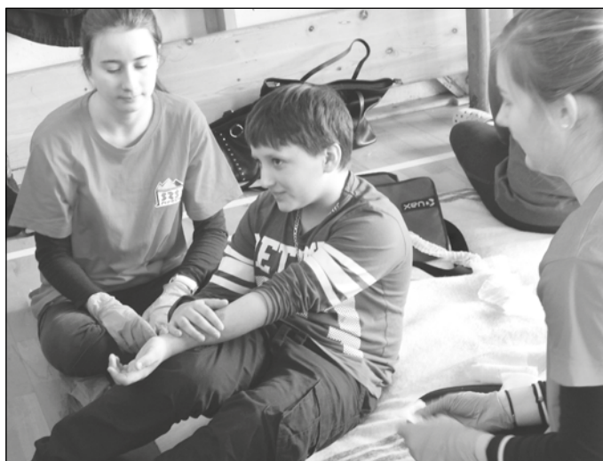
Kurz prvej pomoci absolvovali žiaci druhého stupňa.

Študenti zo SZŠ nám ukázali ako ošetriť rôzne druhy poranenia, ako správne previesť resuscitáciu a stabilizovanú polohu. Bol to pre nás zážitok vidieť rôzne realistické zobrazenia rán, či riešiť modelové situácie, ako napríklad otvorená zlomenina, rezné rany, krvácanie z nosa, popáleniny, dusenie... Okrem toho, sa žiaci mohli naučiť polohovať raneného, ako a kedy použiť stabilizovanú polohu alebo protišokovú polohu. Predviedli nám Heinlichov