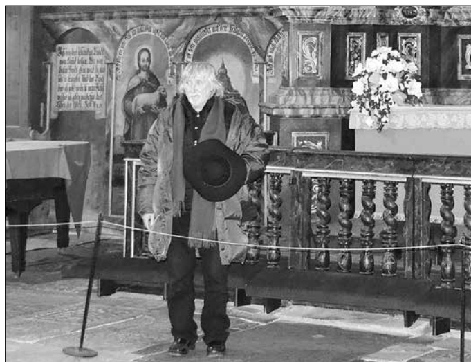
Režiséra Juraja Jakubiska oslnil interiér dreveného artikulárneho kostola.

Znovu sa niektoré scény natočia v drevenom artikulárnom kostolíku, ale tie prídu na rad až