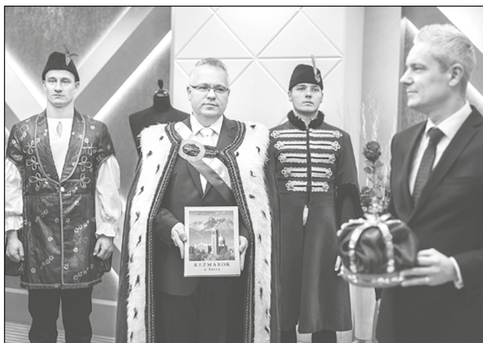
Primátor mesta pred odovzdaním koruny autorovi publikácie.