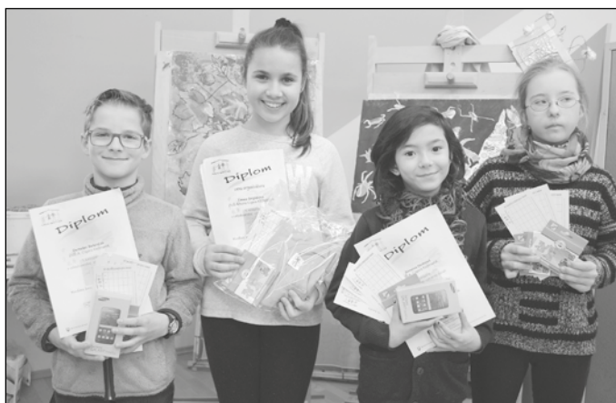
Ocenené mladé talenty.

Do tejto súťaže sa zapojilo 80 základných umeleckých škôl (ZUŠ), súkromných základných umeleckých škôl, ale aj základné školy z celého Slovenska. Úlohou bolo vytvoriť výtvarnú prácu zameranú na nasledovné témy: zdravý životný štýl, ako chcem tráviť voľný čas a prezentovať negatívny postoj k fajčeniu