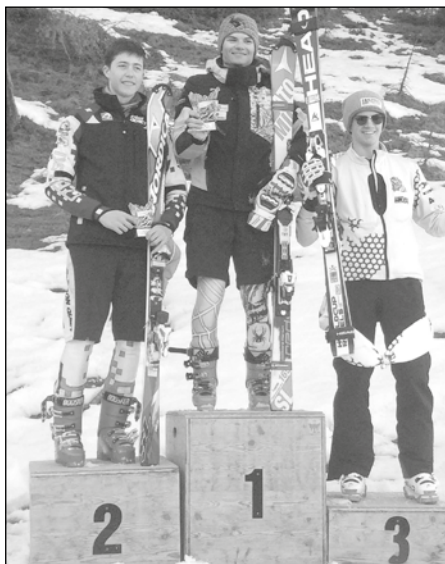
Na stupňoch víťazov.

Pristač SG a Super kombinácia kat. Junior I. miesta, medzi mužmi: Super obrovský slalom 5. miesto, Sup. comb. 4. miesto.