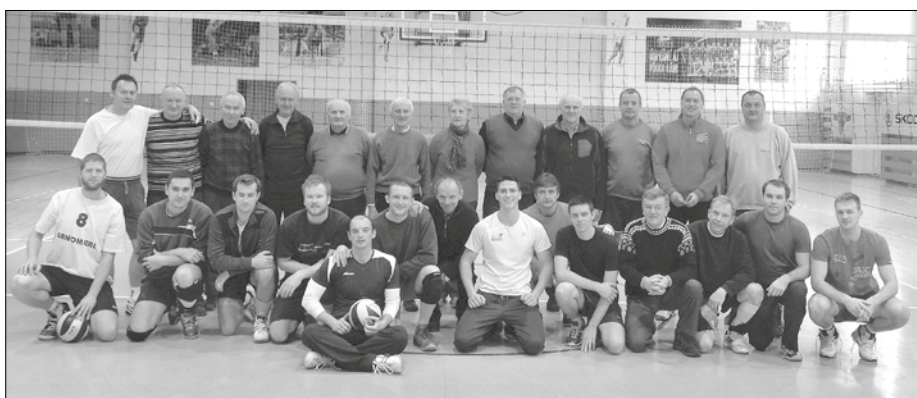
Účastníci volejbalového turnaja.