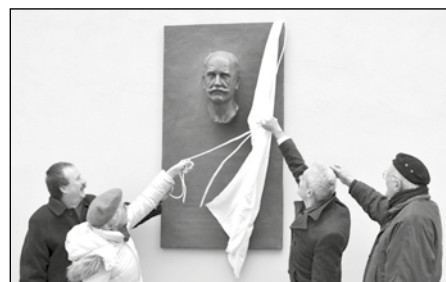
Odhalenie busty MUDr. Vojtecha Alexandra na budove Evanjelického lýcea.

Aj táto schôdza odštartovala krátkou pripomienkou toho, kto bol doktor Alexander a čím sa zapísal do dejín, tentoraz vo forme krátkeho filmového dokumentu o jeho živote. Po ňom už nasledovala odborná časť schôdze a lekári