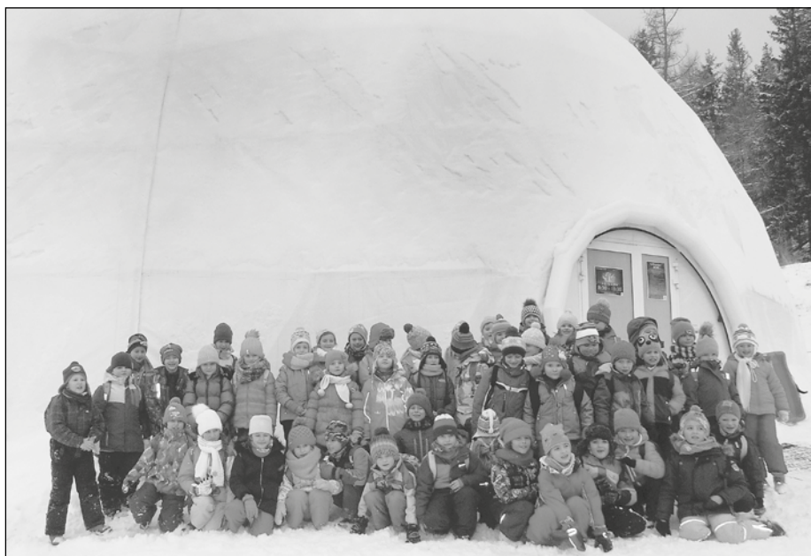
Prváci na Hrebienku.