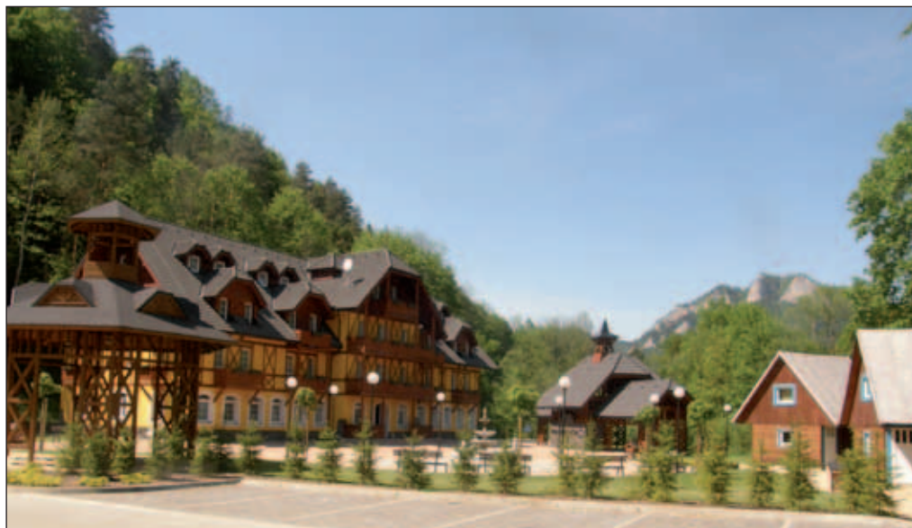
Kúpele Smerdžonka v Červenom Kláštore, v pozadí Tri Koruny.