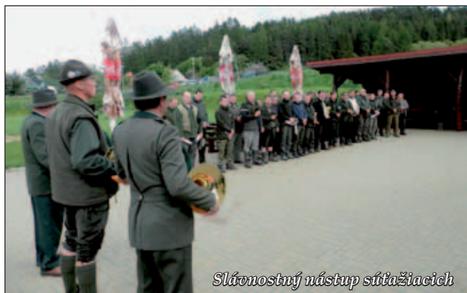
Slávnostný nástup súťažiacich

Situáciu v Kežmarku tak po povodni pomohol zlepšiť aj tento dobročinný dar.